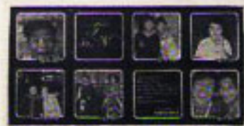
〔上〕フォトショコラは全てフランス製。〔下〕「紀州五代梅心」はこの披露宴で初めて世に出た同じものをプレゼント!!

舗) 創業400年、兵庫県の老舗佃煮専門店「丹波屋」の松茸と昆布の佃煮「千代に八千代に」は、披露宴翌日から通常の約2倍の売れ行きが続いた。同品は、これまで阪急百貨店の8店舗で扱っていたが、新たな百貨店も参戦する。 「伊勢丹さん(東京・新宿)が、ぜひ、ウチでも」となつて……13日から伊勢丹さんでも売ることになったんですが、ウチとここで販売に間に合うよ